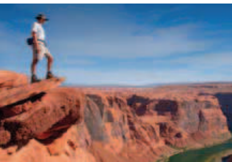
Dobrodružstvá v Colorado

Onedlho začneme aj naše cestovné semináre cestami na najkrajšie miesta planéty. Na rozdiel od iných, u nás máte vždy na výber!