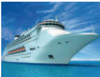
Plavba v Karibiku